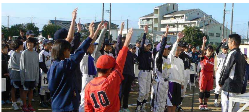
11月3日に開催された秋季スポーツ大会

これからも身体の動く限り、地域のこども達とともに「遊んで・笑って・泣いて・怒って」・・・様々な感動を大切にしながら活動を進めていきたいと考えている。