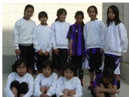
わたしのポートボールチーム